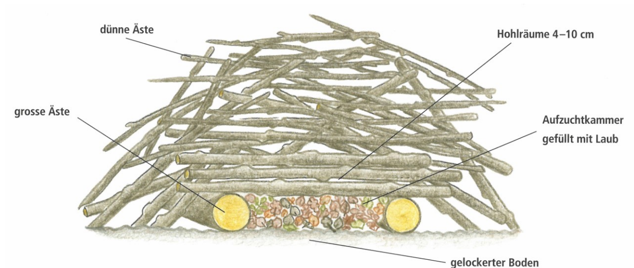
Abbildung 2: Aufbau eines Asthaufens mit Aufzucht-kammer für Wiesel